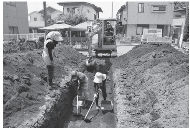
松山遺跡第 78 地点調査風景