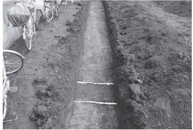
鶴ヶ舞遺跡第 22 地点トレンチ 2