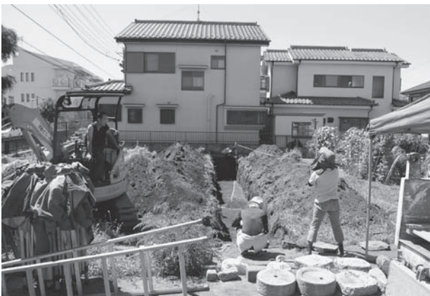
松山遺跡第 79 地点調査風景