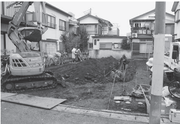
鶴ヶ舞遺跡第 22 地点調査風景