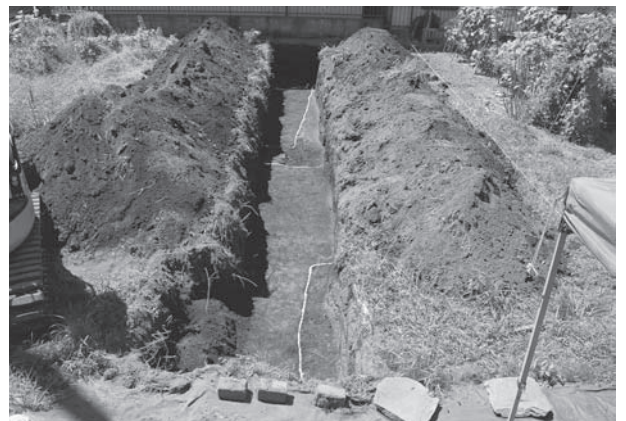
松山遺跡第 79 地点トレンチ 1