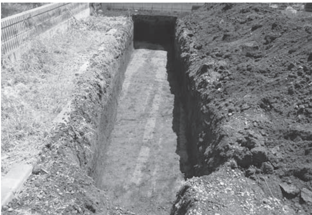
松山遺跡第 78 地点トレンチ 1