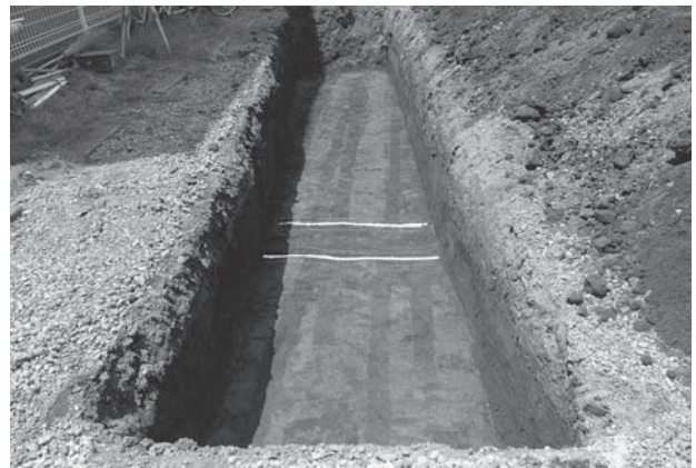
松山遺跡第 78 地点トレンチ 3