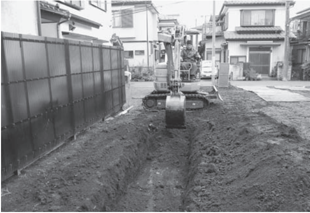
鶴ヶ舞遺跡第 22 地点調査風景