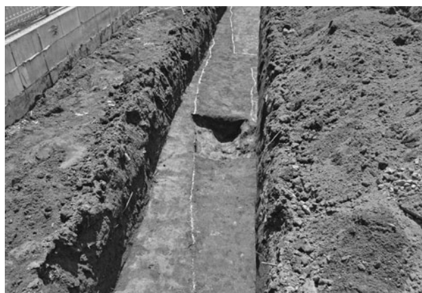
江川南遺跡第 25 地点溝 2