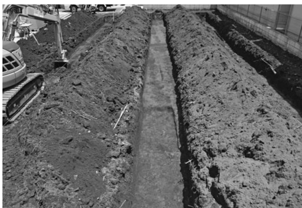
江川南遺跡第 25 地点全景